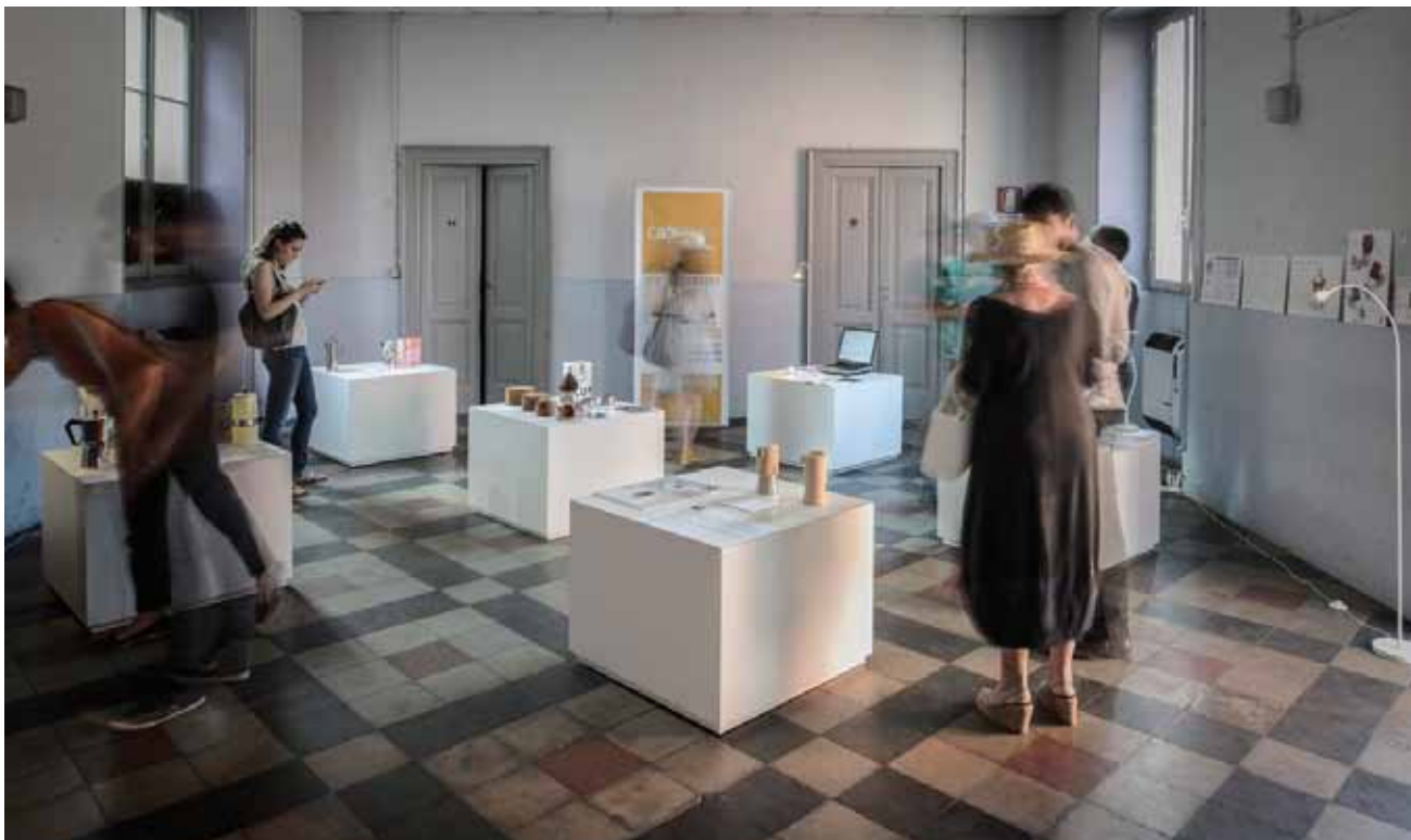
L'ALLESTIMENTO REALIZZATO AD AMENO PER STUDI APERTI-PAESAGGI MIRATI

Si allegano di seguito alcune immagini fotografiche dell'allestimento realizzato per Studi Aperti, alcuni tra gli elaborati grafici di concorso, alcuni scatti del reportage fotografico realizzato da Fabio Oggero.