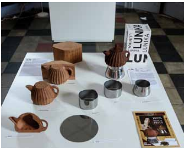
MATERIALI DI LAVORAZIONE PER LA MOKA IN LEGNO