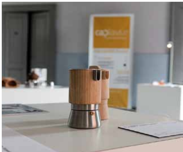
PROTOTIPO DI UNO DEI PROGETTI VINCITORI